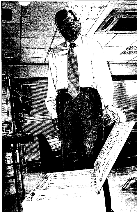
Megino abre la caja contenedora de los 12 tomos del PGOU.

La normativa también establece que este informe no es sustitui-