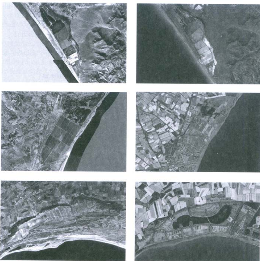
Figura 2. Imágenes aéreas de las salinas de Cabo de Gata (arriba), San Rafael (centro) y Guardias Viejas (abajo) durante 1956-1957 (izquierda;) y 2004 (derecha;). Pueden observarse tres situaciones diferentes en la actualidad, con las de Cabo de Gata casi intactas, las de San Rafael en proceso de destrucción y las de Guardias Viejas totalmente desaparecidas y sustituidas por unas lagunas ornamentales inmersas en urbanizaciones.