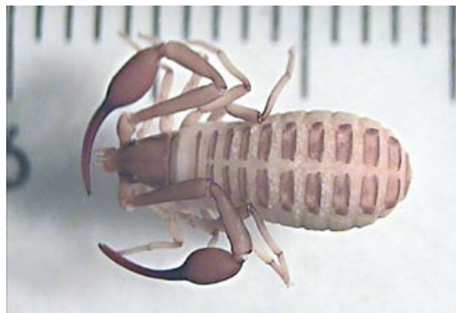
Garypus saxicola es el único pseudoescorpión citado hasta la fecha en la isla. En la foto, ejemplar capturado en una de las últimas visitas.

occidental. La referencia más reciente que se tenía sobre su presencia en la isla es la proporcionada por Osuna y Mascaró (1972), aunque durante los muestreos realizados para este estudio se ha podido confirmar su existencia actual en ella. El área de distribución conocida para esta especie es España (Santander, Murcia, Tarragona e Isla de Alborán) y Portugal. Según J. García (com. pers.), sería muy conveniente un estudio en profundidad de los ejemplares de Alborán, ya que su análisis serviría para aclarar, definitivamente, la distribución efectiva de la especie, frente a la de otra muy próxima y similar, como es Garypus beauvoisii .