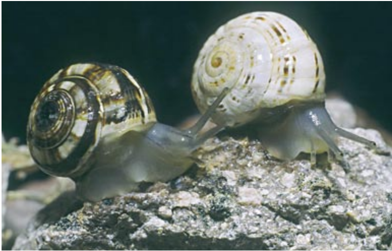
El único caracol terrestre para el que actualmente se ha verificado su presencia en la isla es el polimórfico Theba pisana pisana.