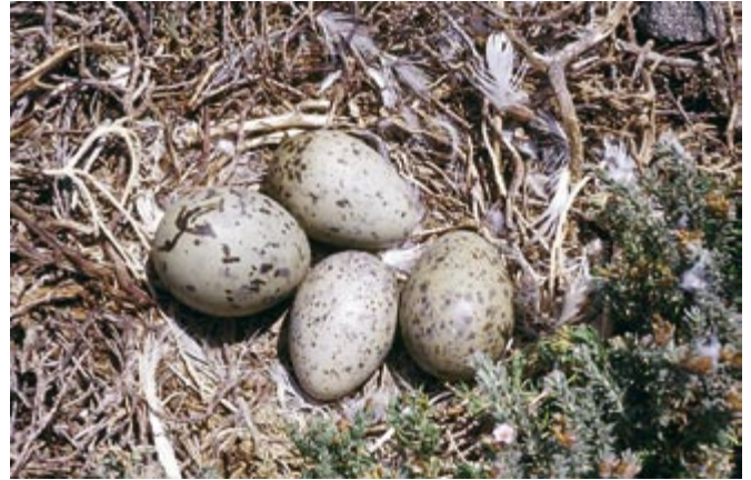
Los nidos de gaviotas y sus alrededores son excelentes lugares para muchos invertebrados durante la época de nidificación, dada la elevada cantidad de detritos que allí se pueden concentrar. En la foto, nido de Gaviota de Audouin ( Larus audouinii ).