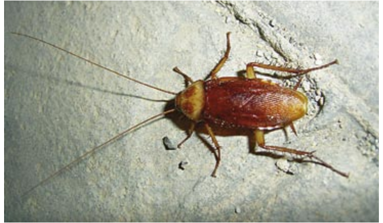
La cucaracha Periplaneta americana es un insecto comensal del hombre que, ocasionalmente, puede presentarse con cierta abundancia.

Especie de grillo que puede resultar estacionalmente muy abundante bajo las piedras que tapizan la superficie de la isla. De hábitos relativamente antropófilos, su presencia no había sido reseñada hasta el momento dentro de Alborán. Se trata quizás de uno de los ejemplos más claros de invertebrados insertados en el frágil ecosistema insular debido a la presencia y actividad humanas.