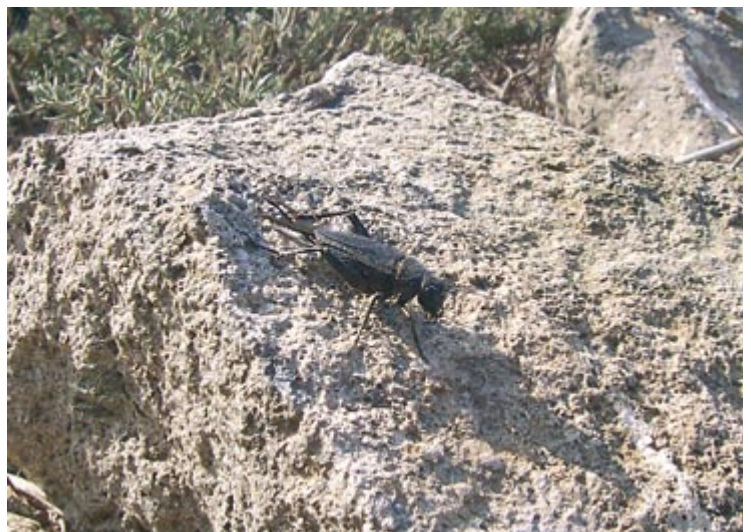
Hembra de Gryllus bimaculatus. Esta especie, muy probablemente importada a Alborán por la actividad humana, aporta una singular nota sonora a las noches estivales de la isla.